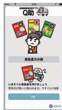
緊急度の分類説明