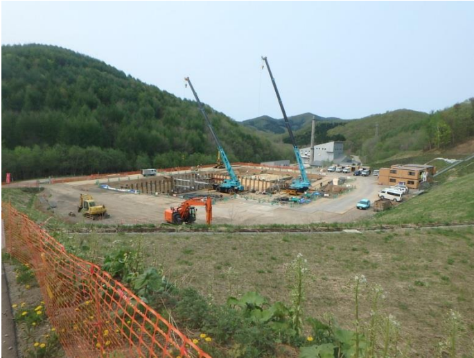
地下部配筋（南側より）