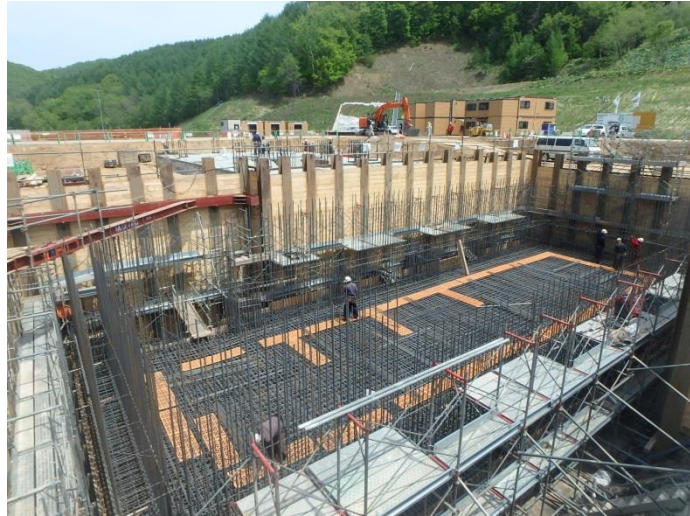
ごみピット下部配筋状況