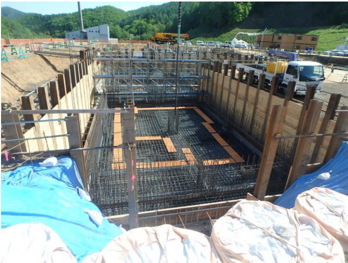
地下雨水槽下部配筋状況